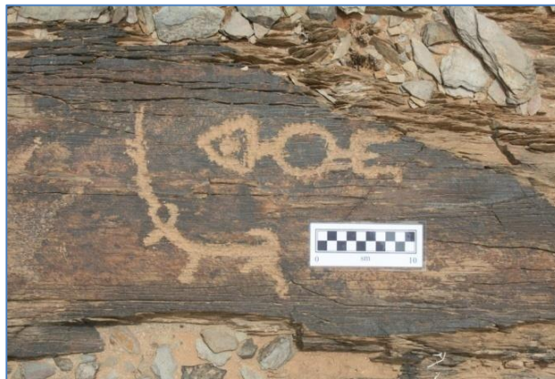
Дэл уулын Өлзийтийн хуудасны нэгэн хадны зураг. 2012.07.18

Судалгааны баг Дэл уулын Өлзийтийн хуудас, баруун Билүүний орчимд 5000 орчим га газар явганаар самналт хайгуул хийж 30 орчим цэгт хадны зургийн шинэ дурсгалыг илрүүлэн тэдгээрийн байршилыг GPS-ээр тогтоож, 1500 орчим гэрэл зургаар баримтжуулсан болно. Мөн төслийн хүрээнд хэрэгжүүлэхээр төлөвлөж буй уран сайхны кино, гэрэл зургийн цомог, интэрнэтэд байршуулах 3D технологи бүхий авто понарамм зэргийг хэрэгжүүлэхэд шаардлагатай бүхий л мэдээллийг хуримтлуулсан байна. Судалгааны баг дурдан буй ажлуудыг төвлөрүүлэн хийх газрыг 3 цэгт зохион байгуулах нь зүйтэй хэмээн үзэж холбогдох мэдээллүүдээр дэлгэрэнгүй тайлан бичиж байна.