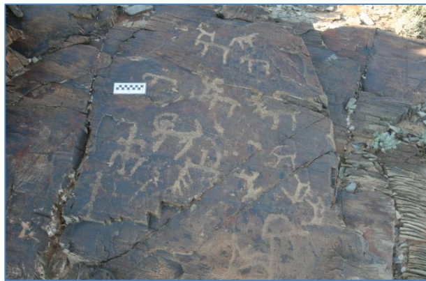
Дэл уулын Өлзийтийн хуудасны нэгэн хадны зураг. 2012.07.18

Судалгааны баг 7 дугаар сарын 16-наас 7 дугаар сарын 23-ныг хүртэлх хугацаанд Дундговь аймгийн Өлзийт сумын нутагт орших Дэл уулын орчимд туршиц судалгааны ажлыг амжилттай хийж дуусгалаа.